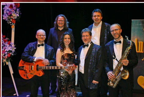
ANDORRAS Tanz- und Galaband